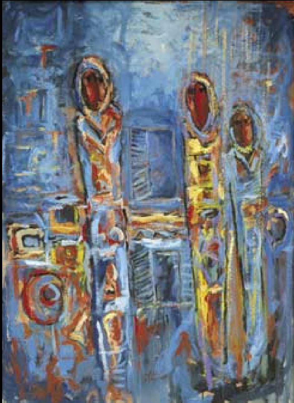
Bashar Al Hroub