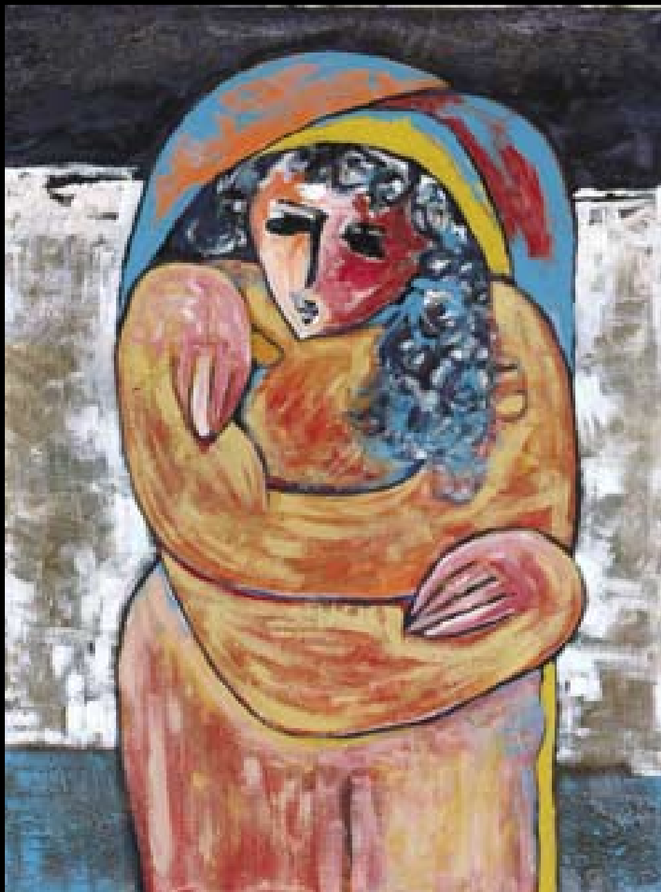
Rima Al Mozaen